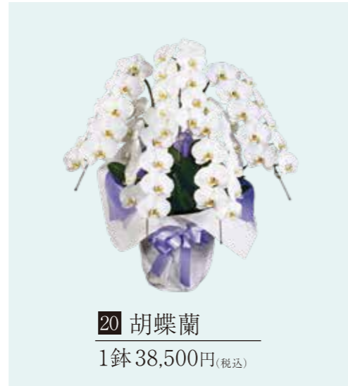
20 胡蝶蘭 1鉢 38,500円 (税込)