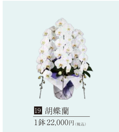
19 胡蝶蘭 1鉢 22,000円 (税込)